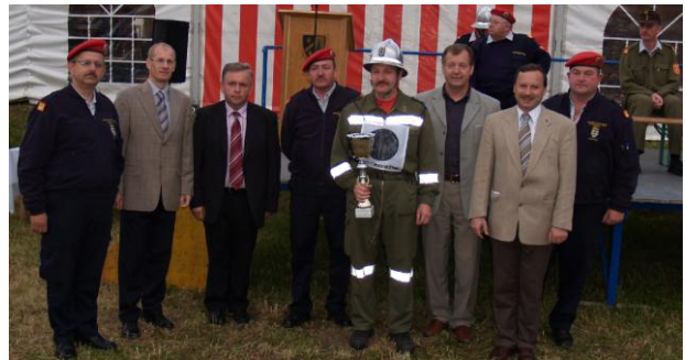
Ein Pokal für die veranstaltende Feuerwehr