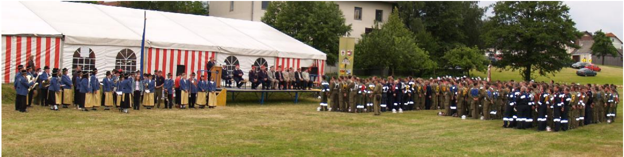
Musikalisch umrahmt wurde die Feier von der Gemeindeblasmusik Heimatklänge Gr. Göttfritz