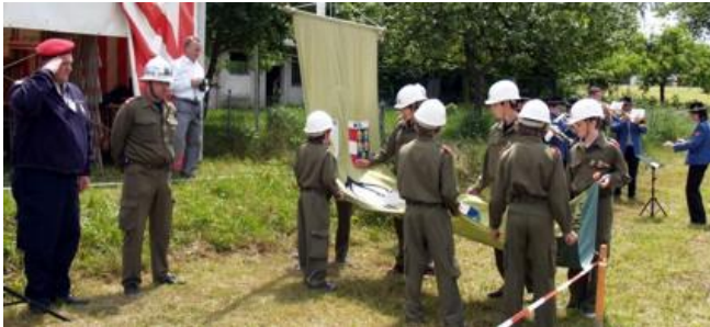
Die Mitglieder der Feuerwehrjugend Großgöttfritz durften die Bewerbsfahne hissen...