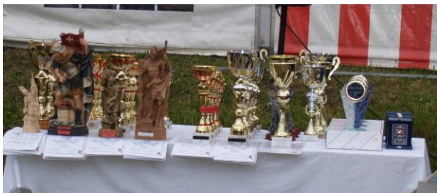
Pokale und Ehrenpreise