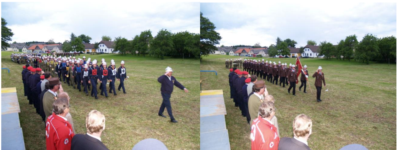
Bewerbsgruppen und Ehrenzug bei der Defilierung